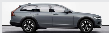
Thunder Grey Metallic-728