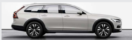
Birch Light Metallic-726