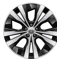
1098- Standard Momentum