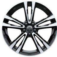
224 - Standard Momentum Pro