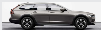
Pebble Grey Metallic-727